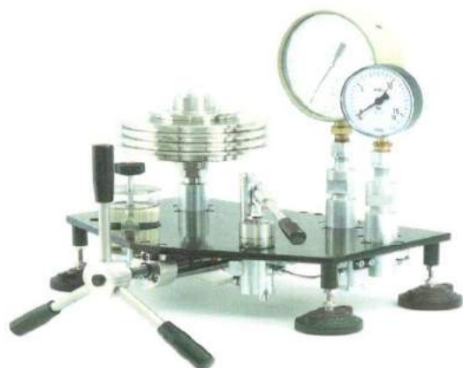
УСД обычного исполнения