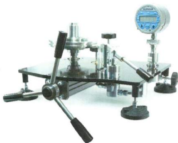
УСД исполнения для высокого давления