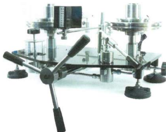
УСД специализированного исполнения