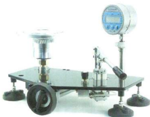
УСД обычного исполнения низкого давления