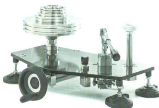
УСД обычного исполнения низкого давления