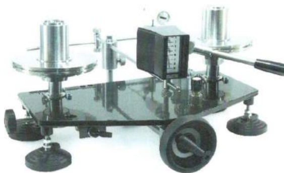
УСД специализированного исполнения